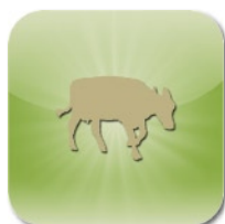
LINEA VITELLI CARNE BIANCA