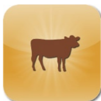
LINEA SVEZZAMENTO RISTALLO