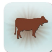
LINEA VACCA DA LATTE