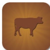
LINEA MANTENIMENTO INGRASSO